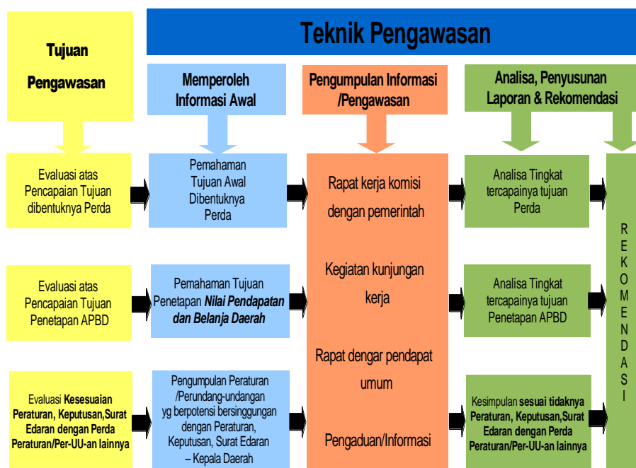
Gambar 1: Urutan teknik pengawasan

Kemudian langkah selanjutnya menentukan teknik pengawasan yang hendaknya diawali dengan mengumpulkan informasi awal, kemudian mengumpulkan informasi dan kondisi aktual di lapangan serta melakukan analisa, dan diakhiri dengan menyusun rekomendasi atas hasil analisa. Urutan teknik pengawasan secara umum dapat digambarkan oleh gambar berikut: