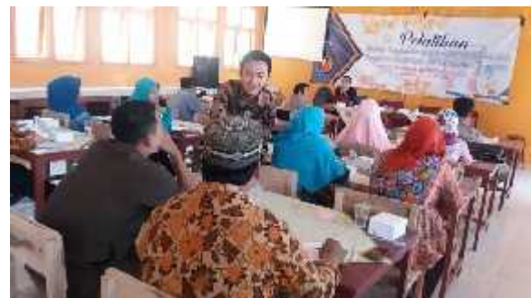
Gambar 1 Kegiatan Pelaksanaan Pengabdian pada Masyarakat

Pada akhir pelatihan. Para peserta mengisi angket kembali untuk mengetahui respon mereka terkait pelaksanaan pelatihan. Berdasarkan hasil angket kami mendapatkan bahwa semua peserta mengatakan ada peningkatan dalam pengetahuan terkait strategi pengembangan perpustakaan sekolah. Hal ini sesuai dengan laporan James (dalam Dewi, 2014) menyatakan bahwa “para responden setuju bahwa hal yang paling mempengaruhi terhadap peningkatan sumber daya manusia adalah dengan diberikannya pendidikan dan pelatihan, dengan demikian akan menciptakan organisasi-organisasi kerja